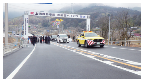
開通式のテープカット・通り初め

なお、上信自動車道の整備は今後も続きますので、関係者の皆様には、引き続きご協力を賜りますよう改めてお願い申し上げます。