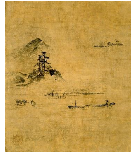
伝 蛇足 《山水図（秋景）》 戸方庵井上コレクション 国指定重要文化財