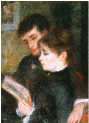
ピエール=オーギュスト・ルノワール 《読書するふたり》