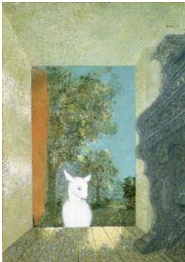
南城一夫 《仔山羊のくる部屋》