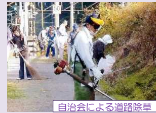
自治会による道路除草