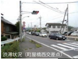
渋滞状況（町屋橋西交差点）