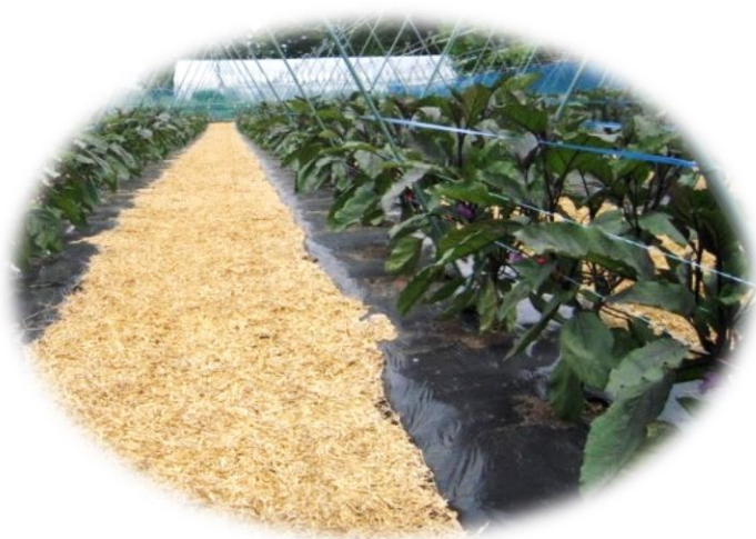
乾燥防止のための 通路への敷きわら