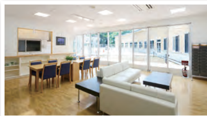
(写真) 群馬県立がんセンター

東邦病院の緩和ケアは、あなたと一緒にあなたの『納得』を探します。人生には、望んでもかなわないこと、思い通りにならないことは確かにあります。あなたがどう生きるかは、あなた自身が『自由』に選ぶことが出来るのです。私たちはあなたの『自由』を最大限尊重します。あなたが自分の人生・今の過ごし方に『納得』できて、暖かな気持ちで日々を過ごせることが、私たちの願いです。これからの人生で大切にしたい何かを見つけ、それを大切にしながら丁寧に生きることをお手伝いします。