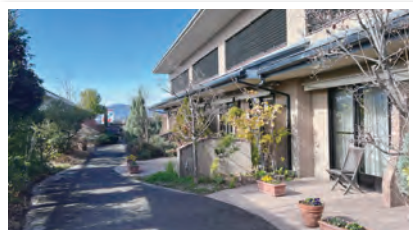
(写真) 公立富岡総合病院