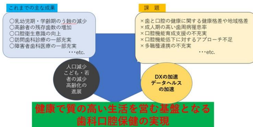
図2：これまでの成果および課題