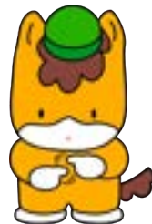
手話を表現している ぐんまちゃん