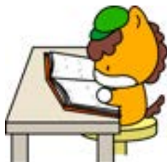
点字資料を読む ぐんまちゃん