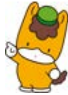
群馬県のマスコット ぐんまちゃん

障害のある人は その障害や 社会の中にある さまざまな障壁（バリア）によって 生活しにくい場合がありますが 周囲の理解や配慮があれば できることがたくさんあります