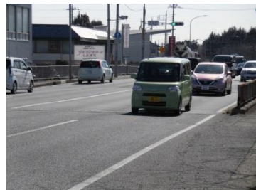
国道17号(第1次緊急輸送路) 交通量(R3)：24,491台/日