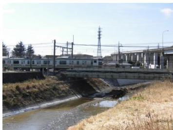
JR高崎線(新町駅) 利用者(R3)：約2,618人/日