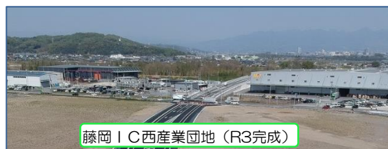
藤岡IC西産業団地（R3完成）