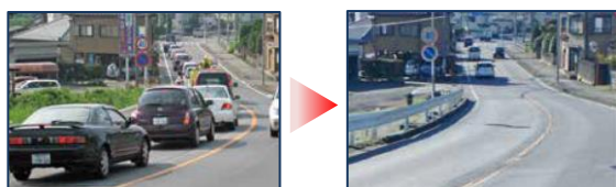
鏡川橋橋詰めの渋滞改善状況（通勤時間帯撮影）