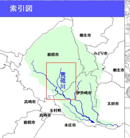
利根川水系荒砥川洪水浸水想定区域図 (家屋倒壊等氾濫想定区域(氾濫流))

1 説明文 (1) この図は、利根川水系荒砥川の水位周知区間について、家屋倒壊等をもたらすような氾濫の発生が想定される区域(家屋倒壊等氾濫想定区域)を表示した図面です。 (2) この家屋倒壊等氾濫想定区域は、現時点の荒砥川の河道の整備状況を勘案して、想定最大規模降雨に伴う洪水により荒砥川が氾濫した場合の氾濫流の状況をシミュレーションにより予測したものです。 (3) なお、このシミュレーションの実施にあたっては、支川の決壊による氾濫、シミュレーションの前提となる降雨を超える規模の降雨による氾濫、内水による氾濫等を考慮していませんので、この家屋倒壊等氾濫想定区域に指定されていない区域においても家屋倒壊・流出等が発生する場合があります。 (4) また、家屋倒壊等氾濫想定区域(氾濫流)は、一定の仮定を与えて算定しており、(3)の条件に加え、倒壊等する家屋は直接基礎の標準的な木造家屋を想定していること、堤防の宅地側には家屋がない更地の状態で氾濫計算をしていること等の理由から、この区域の境界は厳密ではなく、あくまでも目安であることに留意して下さい。 2 基本事項 (1) 作成主体 群馬県土木整備部河川課 (2) 公表年月日 平成29年6月13日 (3) 対象となる水位周知河川 ・利根川水系荒砥川 (実施区間) 左岸：群馬県前橋市大胡町地先(大川橋)から広瀬川合流点まで 右岸：群馬県前橋市大胡町地先(大川橋)から広瀬川合流点まで (4) 算出の前提となる降雨 荒砥川流域の24時間総雨量670mm (5) 関係市町村 <群馬県>前橋市、伊勢崎市