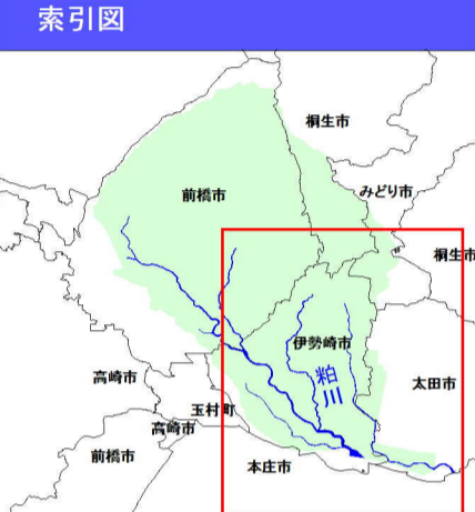
利根川水系粕川洪水浸水想定区域図 (家屋倒壊等氾濫想定区域(氾濫流))

1 説明文 (1) この図は、利根川水系粕川の水位周知区間について、家屋倒壊等をもたらすような氾濫の発生が想定される区域(家屋倒壊等氾濫想定区域)を表示した図面です。 (2) この家屋倒壊等氾濫想定区域は、現時点の粕川の河道の整備状況等を勘案して、想定最大規模降雨に伴う洪水により粕川が氾濫した場合の氾濫流の状況をシミュレーションにより予測したものです。 (3) なお、このシミュレーションの実施にあたっては、支川の決壊による氾濫、シミュレーションの前提となる降雨を超える規模の降雨による氾濫、内水による氾濫等を考慮していませんので、この家屋倒壊等氾濫想定区域に指定されていない区域においても家屋倒壊・流出等が発生する場合があります。 (4) また、家屋倒壊等氾濫想定区域(氾濫流)は、一定の仮定を与えて算定しており、(3)の条件に加え、倒壊等する家屋は直接基礎の標準的な木造家屋を想定していること、堤防の宅地側には家屋がない更地の状態で氾濫計算をしていること等の理由から、この区域の境界は厳密ではなく、あくまでも目安であることに留意して下さい。 2 基本事項 (1) 作成主体 群馬県土整備部河川課 (2) 公表年月日 平成29年6月13日 (3) 対象となる水位周知河川 ・利根川水系粕川 (実施区間) 左岸：群馬県伊勢崎市町地先(赤堤橋)から広瀬川合流点まで 右岸：群馬県伊勢崎市赤堤今井町地先(赤堤橋)から広瀬川合流点まで (4) 算出の前提となる降雨 粕川流域の24時間総雨量666mm (5) 関係市町村 <群馬県>伊勢崎市