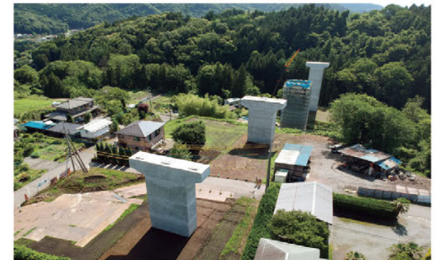
【吾妻東バイパス2期(事業中)】