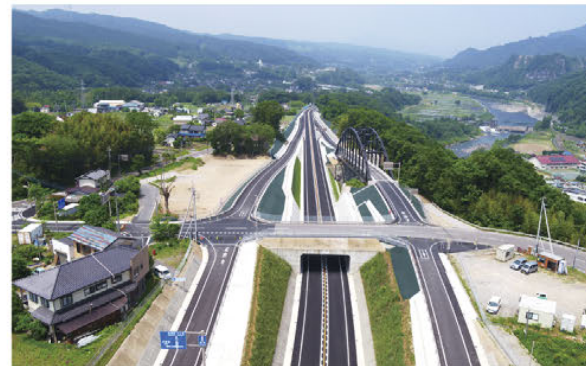
【祖母島～箱島バイパス(岡崎IC)】