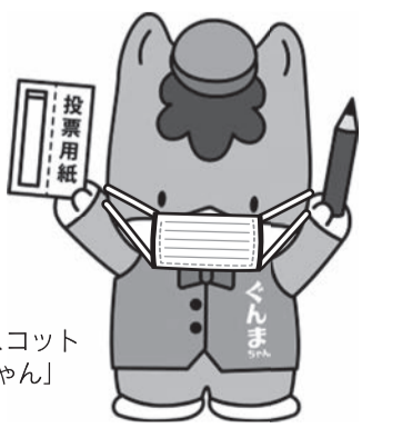
群馬県のマスコット「くんまちゃん」