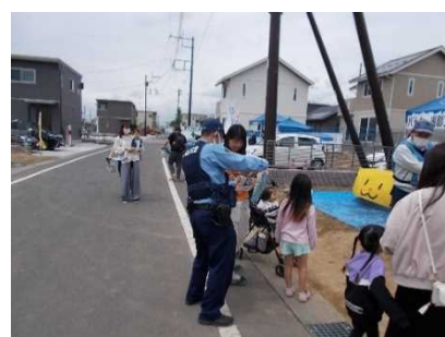
前橋ローズタウン分譲地祭における啓発活動