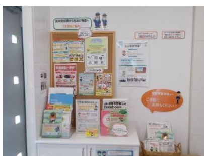
富岡展示場の防犯コーナー