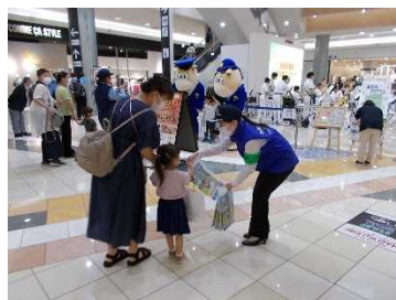
県民防犯の日の活動として特殊詐欺防止等啓発活動を実施しました