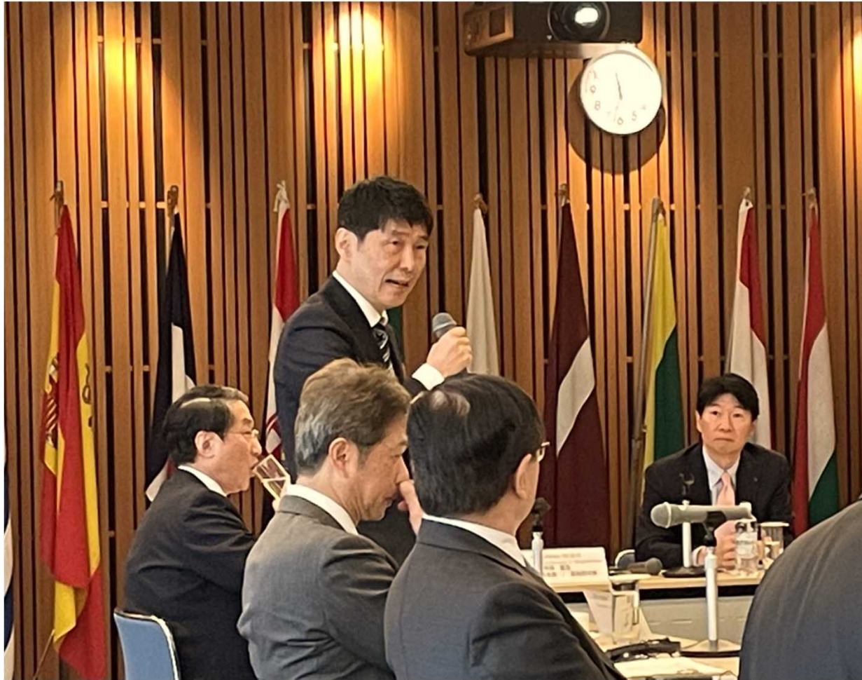
知事によるプレゼンテーション