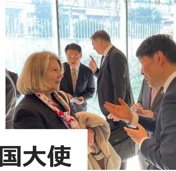
EU各国大使 との意見交換