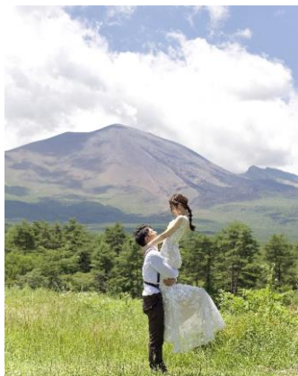
【題名】 浅間山にも祝われて 【撮影場所】 長野原町