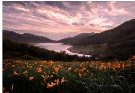
【題名】 目覚めの時 【撮影場所】 中之条町