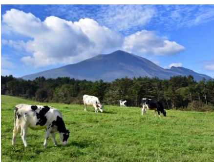
【題名】 牧場の朝 【撮影場所】 長野原町