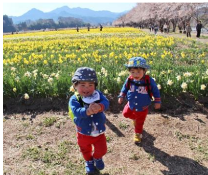
【題名】 仲睦まじく 【撮影場所】 東吾妻町