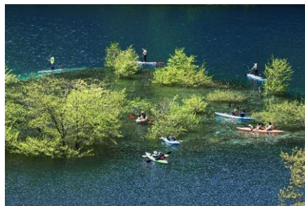
【題名】 水中木とカヌー 【撮影場所】 中之条町