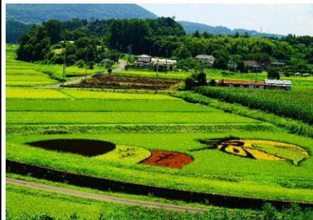
【題名】 田んぼアートの里 【撮影場所】 高山村