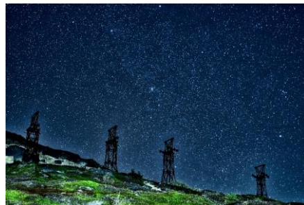
【題名】 破風岳（毛無峠）の星空 【撮影場所】 嬭恋村