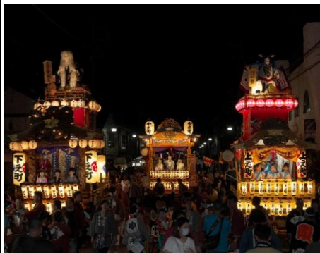
【題名】 祭りは最高潮へ 【撮影場所】 中之条町