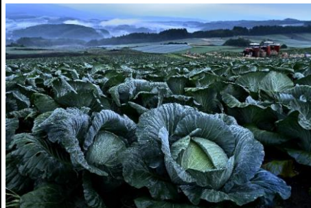
【題名】 キャベツ生誕の地 【撮影場所】 嬭恋村