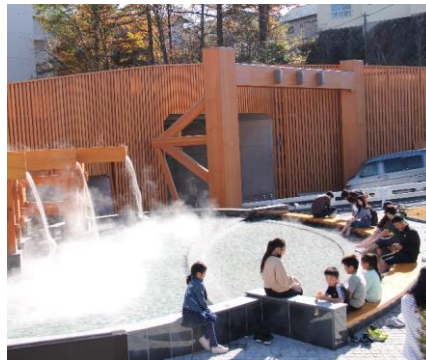
【題名】 名湯の温泉門 【撮影場所】 草津町