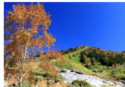
【題名】 爽秋の万座 【撮影場所】 嬭恋村