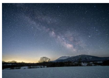
【題名】 煌めく星屑 【撮影場所】 嬭恋村