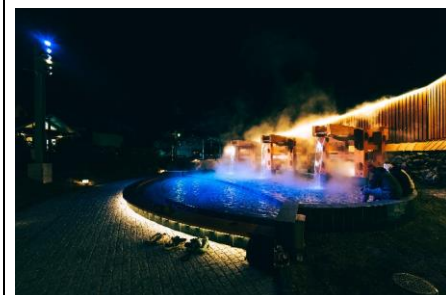
【題名】 足湯団らん 【撮影場所】 草津町