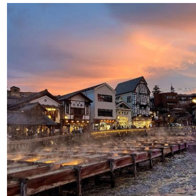
【題名】 夕暮れの湯畑 【撮影場所】 草津町