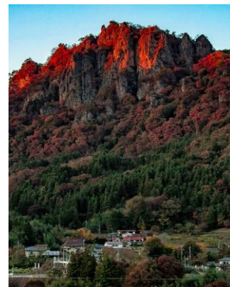
【題名】 紅く染まる 【撮影場所】 東吾妻町