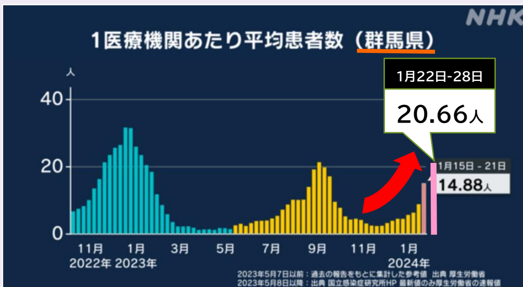
上記グラフの情報:NHK 新型コロナと感染症・医療情報 第4週(1月22日-28日)を追記