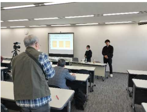
写真2 発表に対して活発な意見 交換が行われました

午前・午後の口頭発表の後には、発表者をパネリストとして参加者全体で意見交換会が行われました。