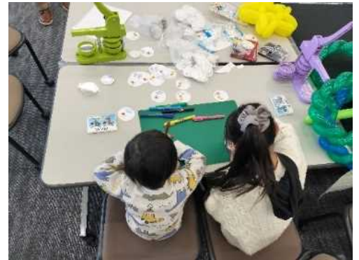
写真1 缶バッジづくり を楽しむ子供たち

今回は、環境政策課と共に実行委員会を設けて準備され、フォーラムは、口頭発表6件、ポスターセッション20件、バルーンアート・缶バッジづくりと、子供から大人まで楽しめる充実した内容で午前、午後の2部構成で行われました。