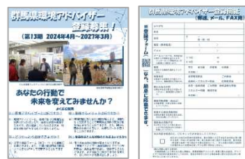
応募チラシと登録用紙

別途送付する応募チラシの登録用紙に必要事項を記入・切り取りの上、郵送等により事務局へ提出願います。