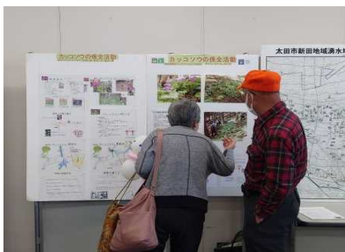
写真 4 ポスターに興味津々

ポスターセッションでは、参加者の方々が自分のペースで興味のあるポスターを見て回ります。ポスター発表者は参加者に声掛けをしながらポスター内容を説明したり、お互いの活動について情報交換をしたり、終始和やかな雰囲気でした。また、ポスターセッションの中央では、バルーンアートと缶バッチづくりを行い、子供たちにも楽しく環境活動にふれてもらうことができました。