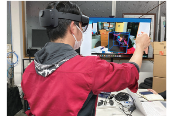
ホロレンズによってMR(複合現実)を体験できる