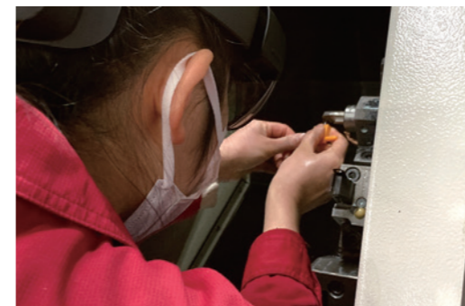
ホロレンズを使用した取り組み

また、現場作業の教育では、現行の手順書を動画に置き換えホロレンズを活用して実際の作業を皆で確認し合うなど、外国人労働者でもわかりやすく覚えられるように新たな取組にチャレンジしています。