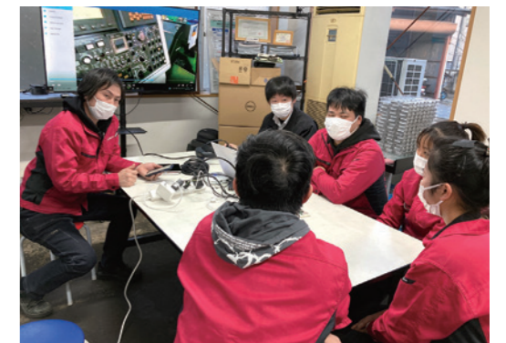
現場作業員のディスカッション