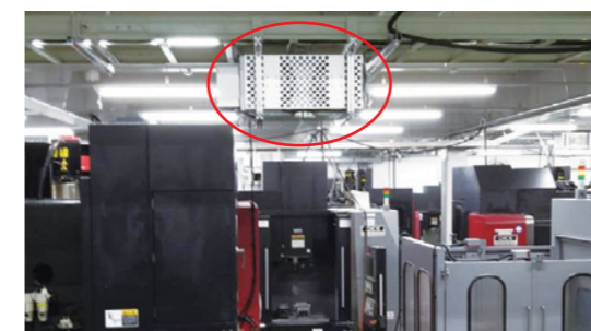
安心安全な製造現場づくりのため自社開発したミスト集塵機

また、同時にエアコンなどのフィルター目詰まりも改善でき、電力削減にも貢献しています。