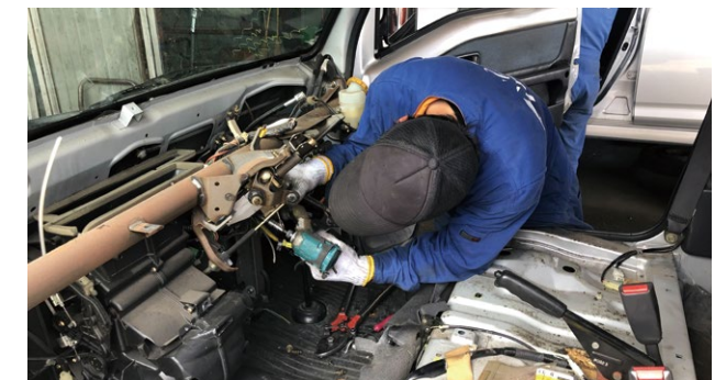
機材だけに頼らず、手作業で取り外しを行い、精緻な解体で細かく精度の高い素材分別を進めます