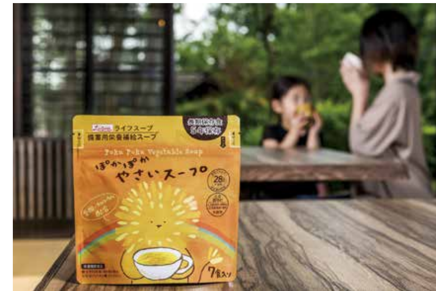
備蓄用栄養補給スープ「ライフスープ」

「ライフスープ」は、日常生活と非常時のどちらにおいても被災者の栄養バランスを整え、健康維持を目的としつつ、要配慮者にも対応した粉末スープタイプの栄養機能食品であり、前橋市・前橋工科大学との産官学連携により開発した備蓄食品です。本商品の梱包・発送作業は群馬県内各地域の就労支援施設で行っています。