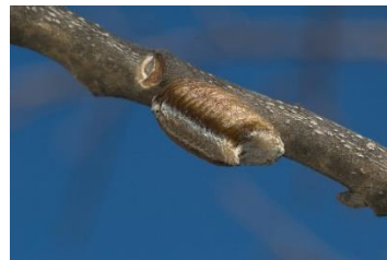
ハラビロカマキリの卵鞘