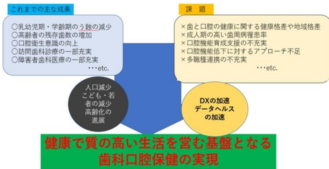
図2：これまでの成果および課題

要介護高齢者など、多職種連携が必要な分野においてはある程度の成果が見られますが、成人病関連疾患などについては、取り組んでいる歯科医療機関はごく少数でした。歯科のみならず多職種に対しての情報発信及び情報共有をさらに推進していく必要があると考えます。