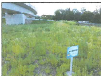
(②発掘場所を示すプレート 写真は鎧を着た古墳人 )