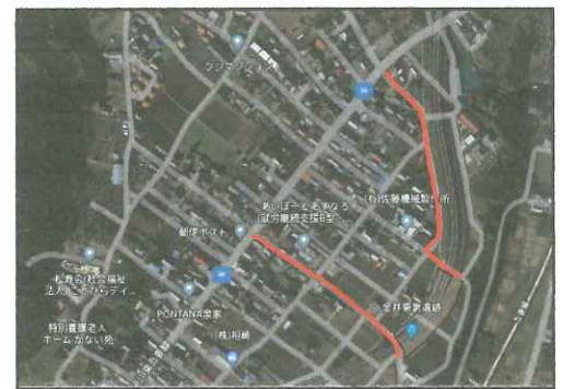
(⑦Google Earthより引用、一部改変)