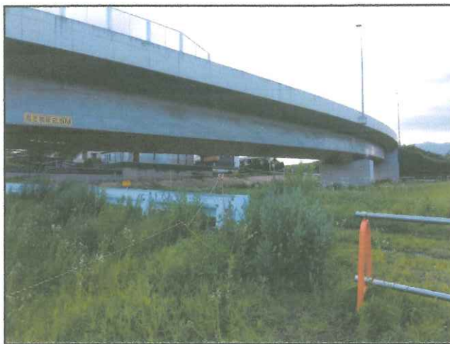
(⑥敷地を分断している道路)