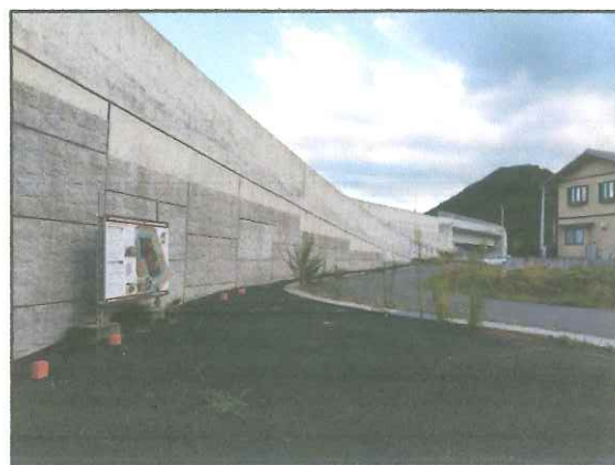
(全体を望む 以下、2023.8.10 自分で撮影)