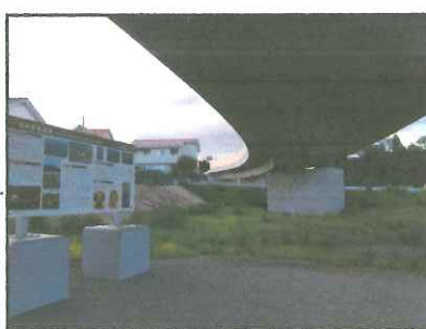
(③解説版と金井東裏陸橋)