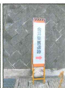
(④金井南牧5号ボックス付近 工事案内用の看板を流用 したもの)