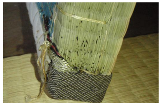
図6 トコジラミの糞（血糞）