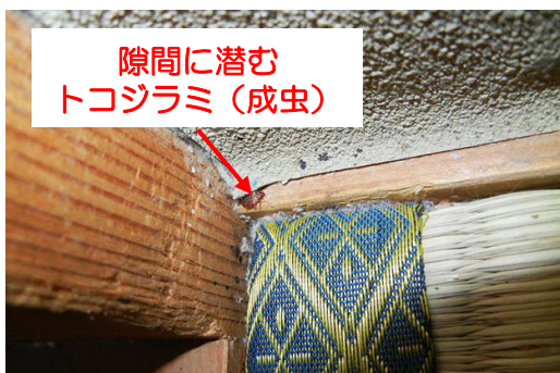
図5 壁の隙間に生息するトコジラミ