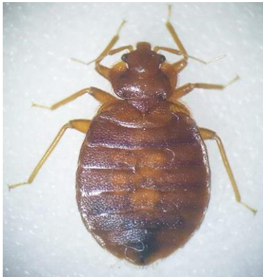
図1 トコジラミ（背面）