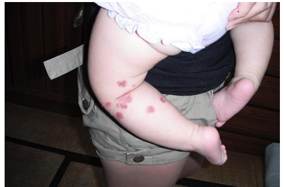
図3 トコジラミに刺された幼児