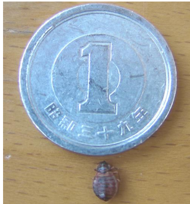
図2 トコジラミの大きさ