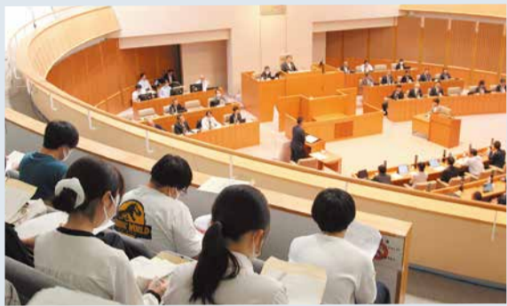
▲議場内で一般質問のやりとりを傍聴する様子

大学生の皆さんは、本会議での県議会議員による一般質問を傍聴した後に各議員と積極的に意見交換を行い、県議会の役割や政治への理解を深めました。 【参加大学】県立女子大学、県民健康科学大学、関東学園大学、東京福祉大学