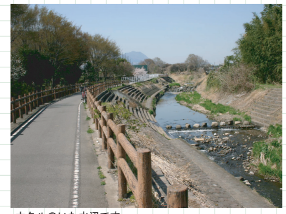
ホタルのいた水辺です。