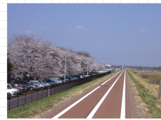
自衛隊駐屯地の桜はみごとです。

箕郷町を水源とする井野川の土手を利用したサイクリングロード。市街地に近く、ロード沿いに高校が多いため、通勤・通学に利用されている。高崎北高脇のグラウンドでは、野球・弓道等のスポーツが盛ん。北高橋の浜井橋をすぎると、ホタルの里サイクリングロードに入り、1km程下った所が浜川運動公園。公園には、子どもの遊び場・芝生広場・運動場があり、チビッコたちがいっぱい。公園脇の井野川にはホタルがいる？(昔はいた)。 大八木橋の交差点をすぎると、終点の国道17号線は間近だ。国道は交通量が多いため、橋の下を通る道路が建設され安全に通れるようになりました。ここより下流は高崎伊勢崎自動車道となる。