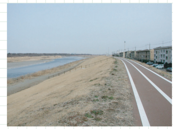
烏川沿いの芝生広場

神流川橋のもと、神流川古戦場跡碑を見て出発。カラー舗装された、真直にのびるサイクリングロードが続く。烏川との合流点近くを左にカーブし、広々とした景色の中、川風がやさしく頬をなでる。 (おもしろMAP高崎版新町ゾーン参照)