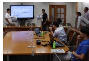
(インターンシップ当日の様子)