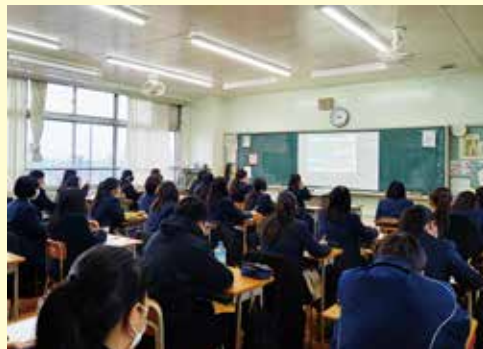
高校での講座の様子（オンライン）