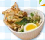
◀キッチンで作った たきあげうどん

※入場は無料。スペース貸出時には料金がかかるものがあります。詳しくはお問い合わせください