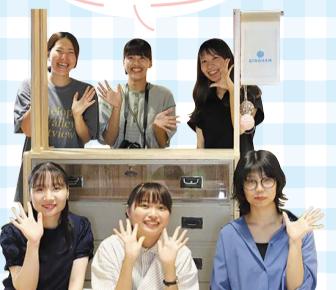
コミュニティマネージャーの皆さん