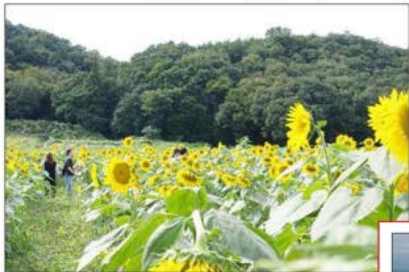
笠懸町吹上地区ひまわり畑