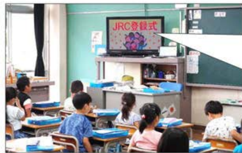
【令和5年度:テレビ放送で実施】