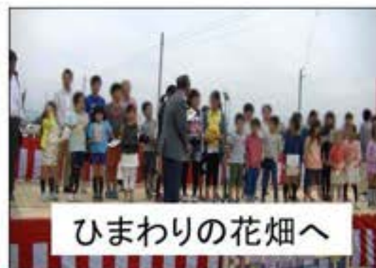
ひまわりの花畑へ