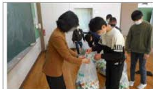
みどり市社会福祉協議会へ(2月)