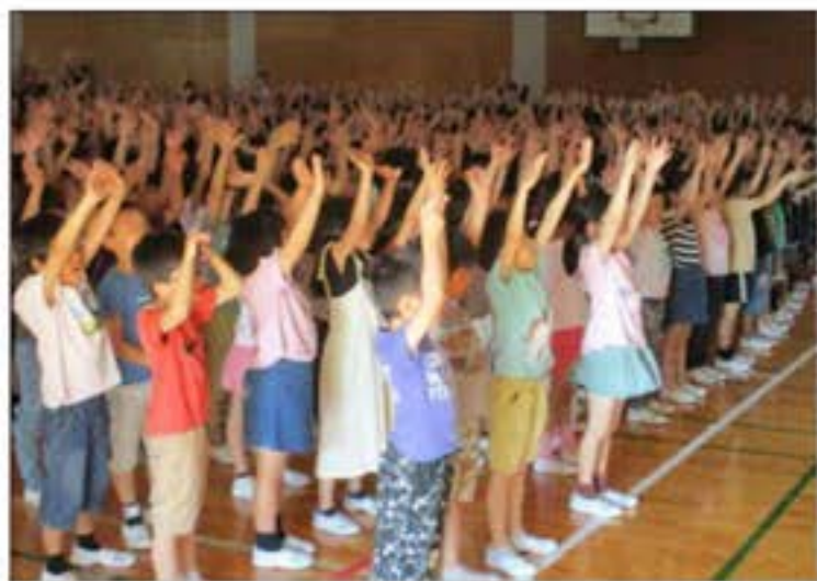
【令和元年度：2年生以上の歓迎の歌】