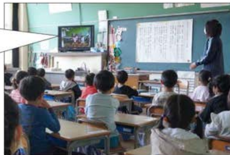
【令和5年度：テレビ放送で実施】