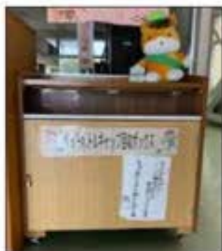
エコキャップ回収箱 (職員室前)