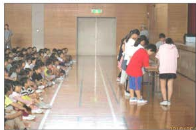
【令和元年度:各学年代表が署名】

・登録式では、 スライドを使って「JRCの活動内容」の説明 を行い、署名式及びバッジの授与を行っています。