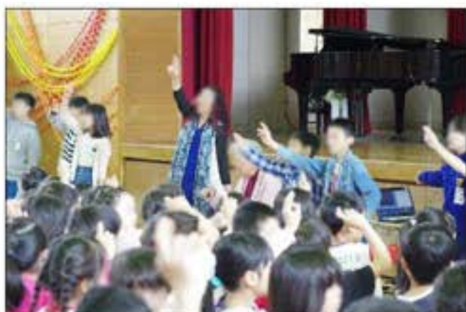
第2校歌「ひまわりの花畑」 全校で手話を付けて