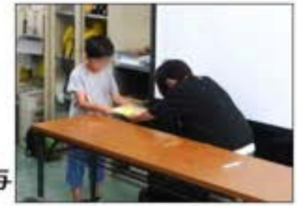
1年生へ バッジの授与