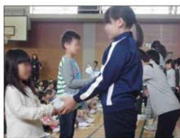
ひまわりの種の引継