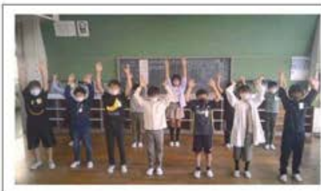
4月の委員会の時間に撮影