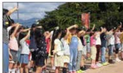
「ひまわりの花畑」を手話と一緒に披露