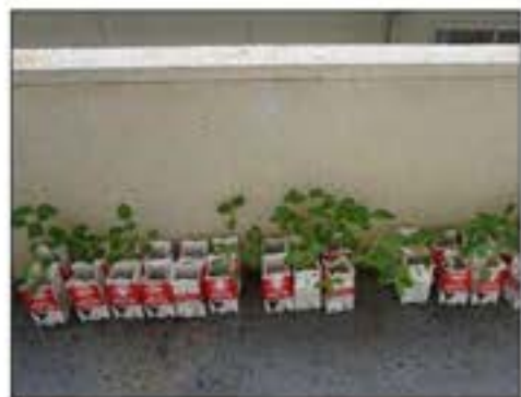
各教室のベランダ