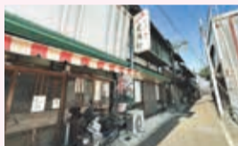
「映える」と話題の下仁田駅前の商店街は、レトロな街並みと雰囲気ある飲食店が並びます

両毛線などで活躍し、平成29年に引退したJR東日本107系が上信電鉄に譲渡され、現在も運行中。JRカラーの車両もあります