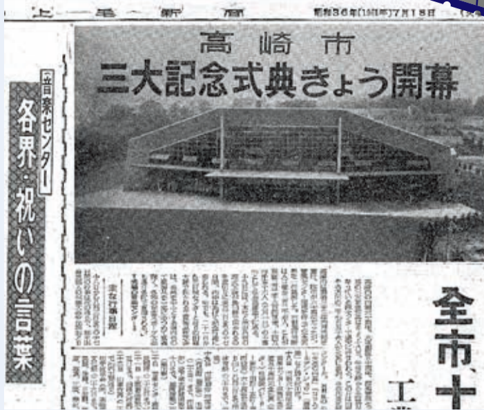
昭和36年(1961年)7月18日付 上毛新聞