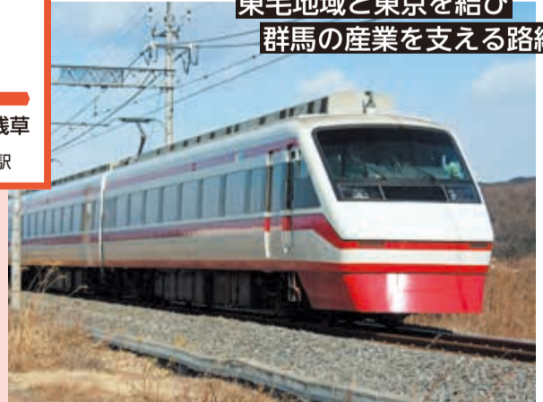
主に浅草駅～赤城駅間を、東武伊勢崎線・桐生線経由で運行している特急列車の「りょうもう」