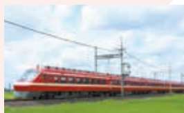
伊勢崎駅から浅草駅までの路線距離は114.5*で、私鉄の中では最長です

平成29年に登場し、伊勢崎線などで活躍中。Wi-Fiが完備の上、各座席にはコンセントもあり、快適な鉄道旅を楽しめます