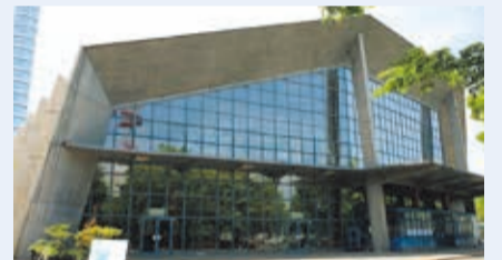
設計は日本の近代建築に大きな影響を与えた巨匠、アントニン・レーモンド氏