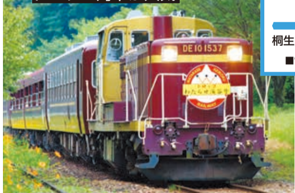
「トロッコわたらせ渓谷号」は、ディーゼル機関車が4両の客車を引っ張る、昔ながらのスタイルが人気の観光列車