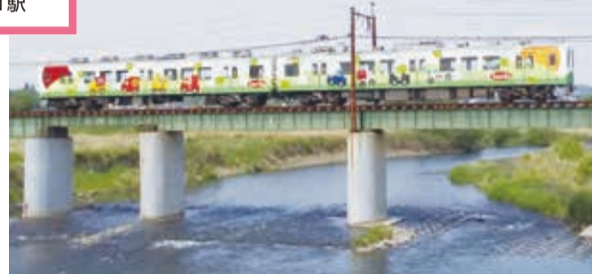
かつて渡し船が運行されていた「佐野のわたし」。現在は列車用の橋に並行して歩行者用の橋が架かっており、撮影スポットとして人気です