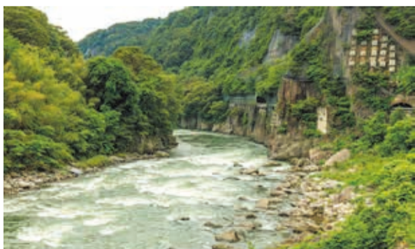
夏にはやな場も開かれ県内各地でアユ料理を味わえる (写真: 渋川市の綾戸梁周辺)

初夏を中心に食卓を彩るアユは「県の魚」に指定されるほど、群馬にゆかりの深い魚です。県内各地の河川に生息していて、アユ釣りを楽しむ釣り人の姿は夏の風物詩となっています。かつては豊富な漁獲量を誇ったアユですが、近年は漁獲量が減少しています。きれいな河川を守るため私たち一人一人の心がけが大切かもしれません。