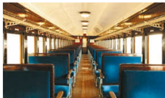
製造当時をイメージした「ラウンジカー付き」旧型客車

全国的にも珍しい、県内にSLが2路線運行している群馬県。上越線の「高崎駅~水上駅間」と信越本線の「高崎駅~横川駅間」で、それぞれD51 498(デゴイチ)とC61 20(シロクイチ)が走っています。けん引する客車は2種類あり、旧型客車では座席に備え付けられた栓抜きや織物柄をモチーフにしたブラインドなど、レトロな雰囲気を楽しめます。煙を上げて走る勇姿は必見です。