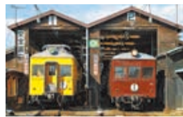
国の登録有形文化財である大胡電車庫は、建物や希少な車両の見学が可能です