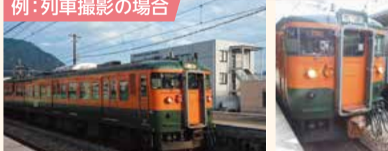
列車を撮影する場合、横で撮影すれば、列車の動きを伝えやすくなります。被写体によって、縦と横を使い分けてみてください