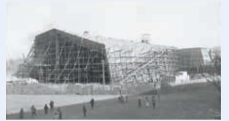
音楽を愛する市民の協力により着工

開館から令和元年9月まで、群響の本拠地として定期演奏会を中心に、さまざまな公演が催されてきました。施設についても高く評価され、平成3年には群馬音楽センターの前庭が、国土交通省主催の手づくり郷土賞(施設部門)を受賞。平成11年にはDOCOMOMO Japanが選定する「日本の近代建築20選」にも選ばれました。折板構造(不整形折面架板構造)の独特な外観は、日本の代表的なモダニズム建築の1つとされ、高崎市の文化の象徴として親しまれています。