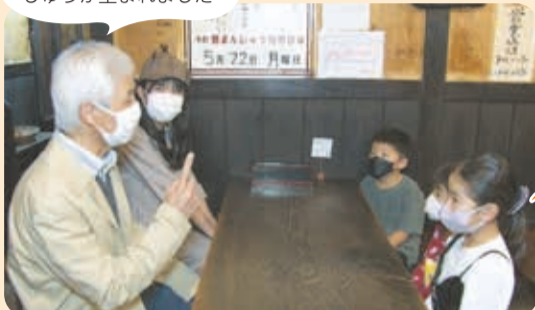
横田先生から焼きまんじゅうの歴史や起源について説明を受ける探偵団。身近な食べ物なのに、知らないことだらけだな～