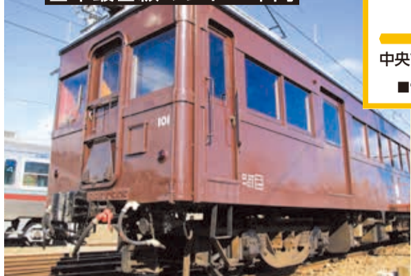
デハ101は開業時に製造された6両のうちの1両で、レトロ感あふれるデザインが人気。現在はイベントで臨時運行される他、個人での貸し切り運行も可能