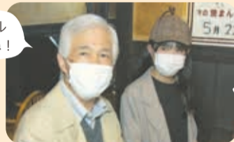
今日は焼きまんじゅうについて詳しくなったね!