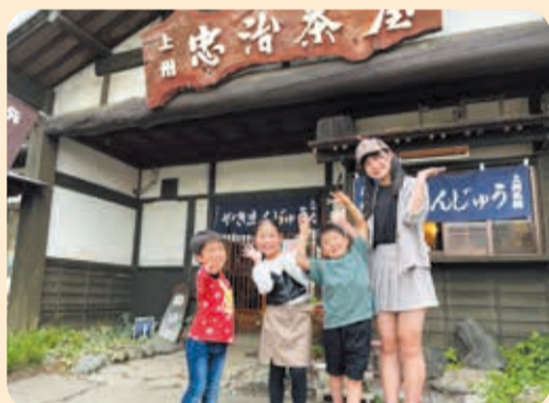
伊勢崎市の焼きまんじゅう屋さんへ調査にやってきました。お店の外にも食欲をそそる香りがしてきますよ～♪