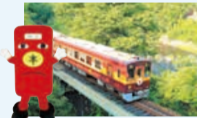
わたらせ渓谷鐵道のキャラクター「わ鐵のわっしー」をモチーフにした「トロッコわっしー号」