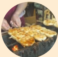
お店で売られるようになって、串に刺すようになりました