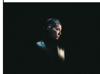
Meta Flower メタ フラワー