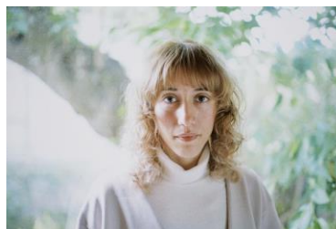
アナイス・カレニン