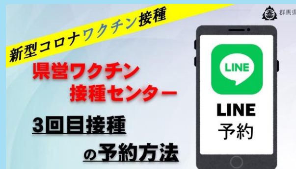
県営ワクチン接種センター予約方法 LINEのインストール方法から実際の 施設予約までを案内