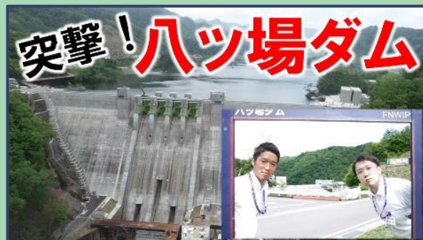
グンマー×ヤンバー ハツ場ダムや周辺の観光施設情報を 県職員がご紹介