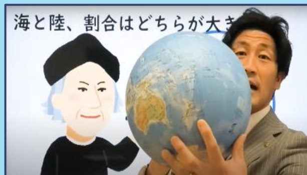
オンラインサポート授業 休校中の児童生徒向けに200本以上 を公開し、在宅学習を支援