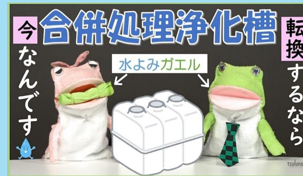
各種制度の利用促進 県のさまざまな制度を分かりやすく 紹介して利用を啓発