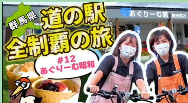
群馬県 道の駅 全制覇の旅 tsulunოს室員がリポーターとして 県内の道の駅情報をお届け