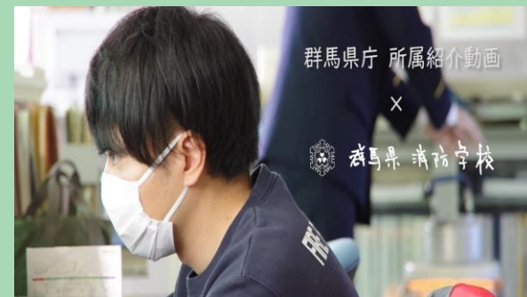
3分でわかる〇〇課 県庁の各所属が担当する業務などを ご紹介