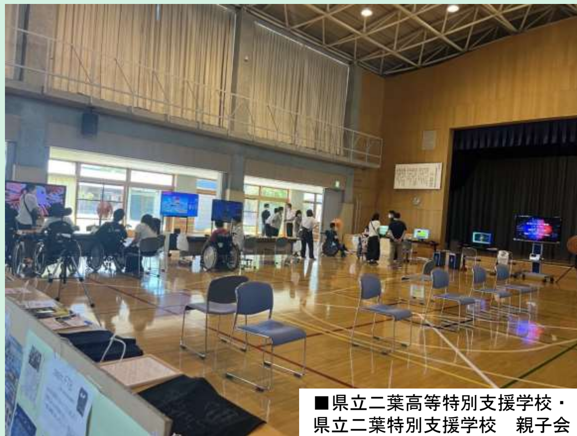
■ 県立二葉高等特別支援学校・ 県立二葉特別支援学校 親子会