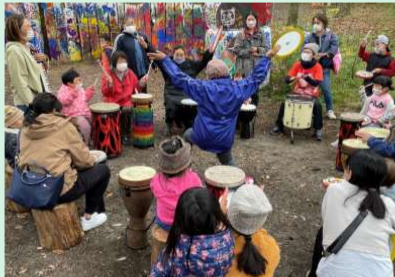
■ 群馬県障害者芸術文化 活動支援センター