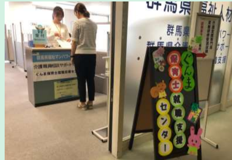
■ ぐんま保育士就職支援センター