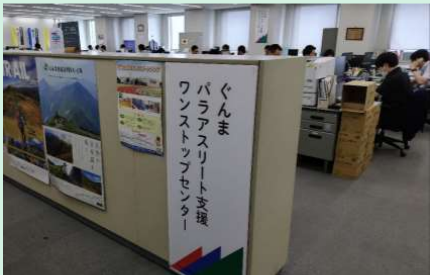
■ ぐんまパラアスリート支援 ワンストップセンター