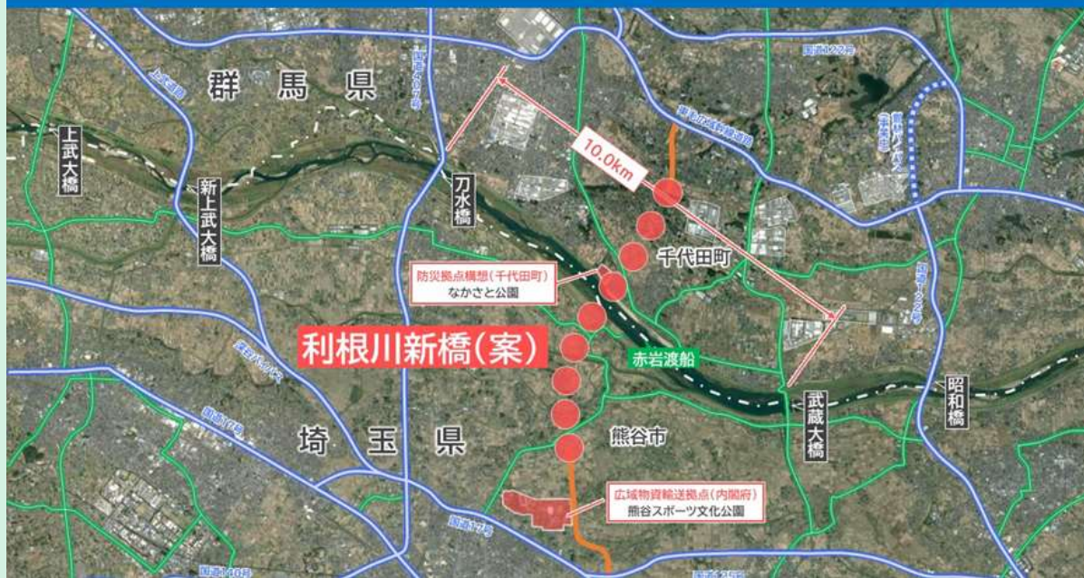
利根川新橋(赤岩) 想定ルート図