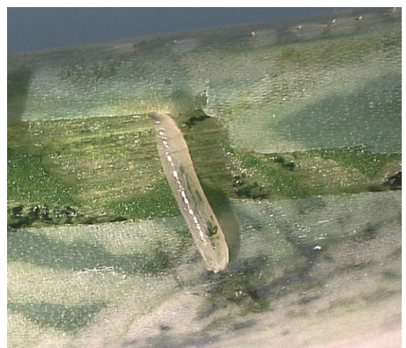
写真3 ネギハモグリバエ幼虫

*農薬を使用する際には、ラベル等を確認し使用基準に従って適切に使用してください。