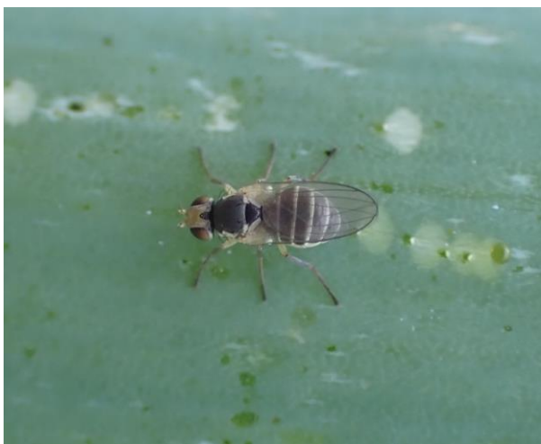
写真2 ネギハモグリバエ成虫