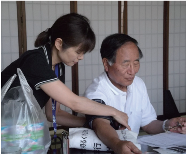
定期的な測定で高齢者の健康を守る