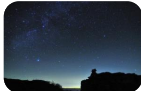
ナイトプログラム・星空観察 (イメージ)