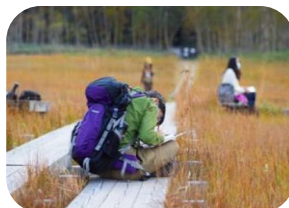
尾瀬現地学習 (イメージ)