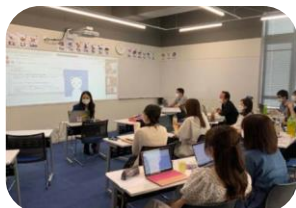
Tech事前学習 (イメージ)