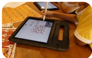
STEAM KIT (AIxAR) 利用した探究学習 (イメージ)