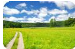
尾瀬国立公園(イメージ)