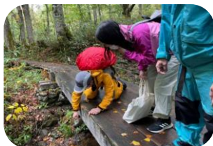
尾瀬現地学習 (イメージ)