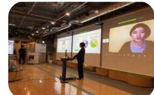
成果発表会 (イメージ)