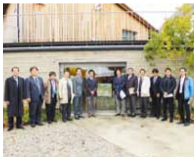
山形エコハウスにて

①最上町バイオマスエネルギー関連施設（山形県最上郡最上町） 「バイオマス産産都市」の認定を受ける同町は、豊富な森林資源を基に木質バイオマスの活用を進めています。再生可能エネルギーの導入・拡大に向けた参考とするため取組状況を調査しました。 注1 バイオマス産産都市：産業創出と地域循環型エネルギーの供給強化により、環境にやさしく災害に強いまち・むらづくりを目指す地域 ②山形エコハウス（山形県山形市） 山形エコハウスは、山形県が環境省の補助を受け東北芸術工科大学と連携し建設した低炭素社会における住宅の未来形を示すモデルハウスです。研修会・見学会等市民に開かれた取組も実施しており、低炭素社会における住宅の未来を考える上で参考とするため取組状況を調査しました。