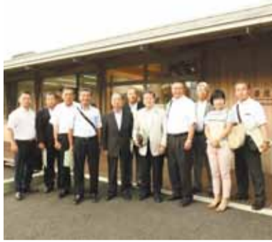
阿蘇草原保全活動センターにて

①日明浄化センター（福岡県北九州市） 水ビジネスの国際戦略拠点である同センターについて、海外への水道等の技術提供の参考とするため取組状況を調査しました。 ②阿蘇草原保全活動センター（熊本県阿蘇市） 阿蘇の草原の保全、学習及び利活用の拠点施設である同センターは、草原の保全再生を通じての観光や地域振興の活動を行っています。また、阿蘇地域は世界農業遺産に認定されており、観光や地域振興の参考とするため取組状況を調査しました。 ③熊本県庁（熊本県熊本市） 熊本県では「くまもと県南フードバレー構想」を策定し、県南地域の活性化を目指しています。特にアジアにおける貿易拡大、首都圏への販路拡大、アジア地域との経済交流について国際戦略の参考とするため取組状況を調査しました。