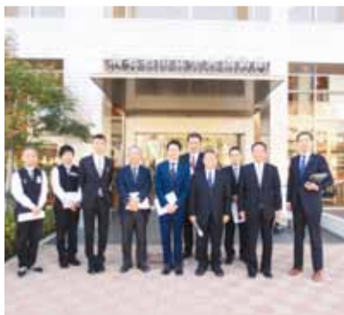
海老名市立中央図書館にて

①海老名市立中央図書館（神奈川県海老名市） 指定管理者制度により民間事業者が業務委託された同館の運営状況について調査しました。 ②愛知県議会（愛知県名古屋市中区） 議会だよりをはじめとする議会広報の取組や議員の調査に対応する議会図書室の運営状況について調査しました。