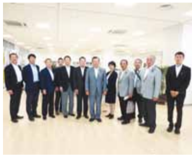
大学連携支援センター「Fスクエア」にて

①大学連携支援センター「Fスクエア」（福岡県福岡市） 福岡県内のすべての大学、短期大学、高等専門学校に通う若者が気軽に集い学べる拠点である同施設は、若い世代の県内定着を促進するための事業を実施していることから、若者の活躍推進の参考とするため取組状況を調査しました。 ②福井県庁（福井県福井市） 福井県では、子育て世帯に対し経済的応援、職場環境の整備等の効果的な独自事業を展開しているほか、発達障害の早期発見のため支援ツールを開発・普及していることから、これらの取組状況を調査しました。 ③石川県庁（石川県金沢市） 石川県では、「いしかわ結婚支援センター」設置や「三世代ファミリー同居・近居促進事業」等で若者や子育て支援に取り