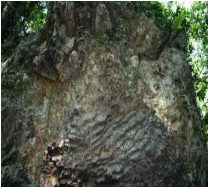
自然の家の不整合