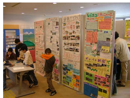
昨年度の交流会の様子