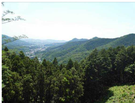
【ノスリ観察舎からの眺め】