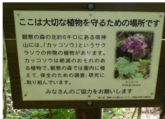
【カッコソウを守るための研究が行われている】