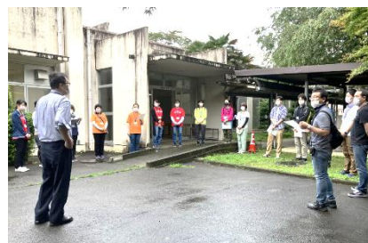
サポーターのみなさん