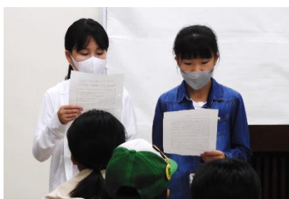
メンバー代表あいさつ