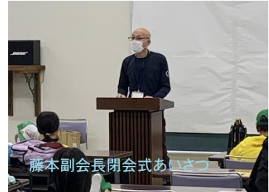
藤本副会長閉会式あいさつ