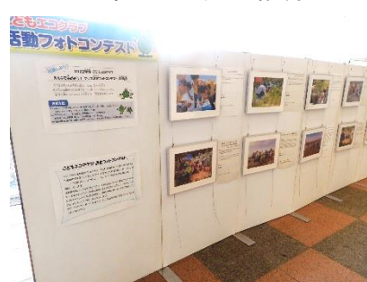
フォトコンテスト会場