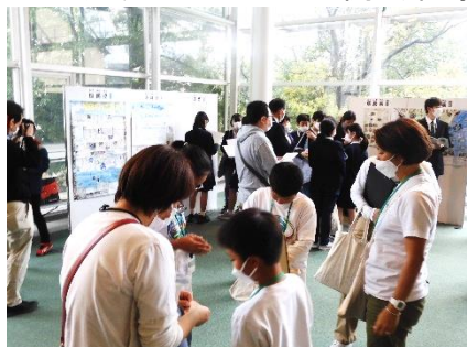
参加者でにぎわうロビー