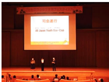
エコクラブOBによる開会行事

全国大会へは壁新聞の応募のあったクラブの作品の独創性・発展性・アピール力・地域への密着性等の観点で本部で審査され各都道府県から1クラブ選出がされます。