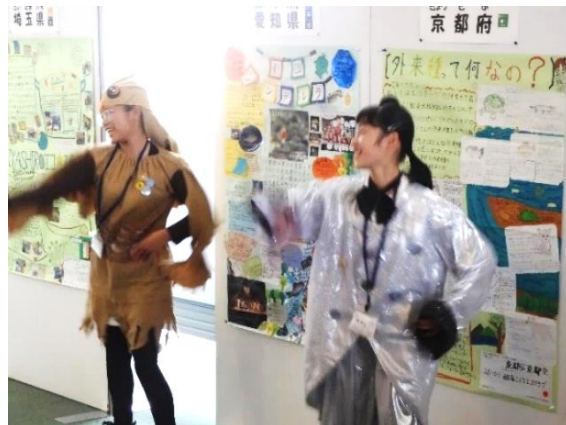
歌って踊る愛知県のクラブ