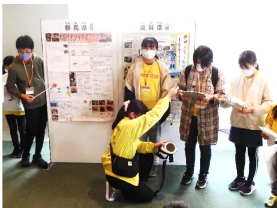
太田イオンチアーズクラブ