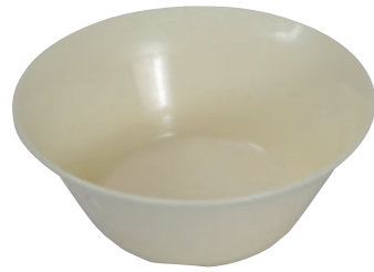
01 クリームおわん ●サイズ=133×50mm ●容量=360cc ●使用例=スープ