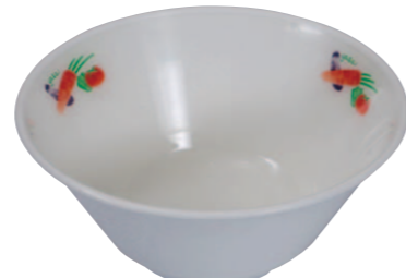
03 柄付きおわん大 ●サイズ=145×60mm ●容量=500cc ●使用例=うどん・そば