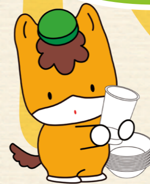
群馬県のマスコット 「ぐんまちゃん」 登録第 27-101096 号