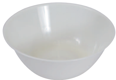
07 ホワイトどんぶり大 ●サイズ=185×70mm ●容量=1000cc ●使用例=うどん・そば