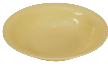
10 黄色丸皿※ ●サイズ=190×37mm ●使用例=焼きそば・焼まんじゅう