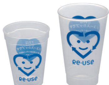
11 カップ(大・小) ●大サイズ=80×130mm ●大容量=450cc ●小サイズ=70×100mm ●小容量=280cc ●使用例=ドリンク・かき氷