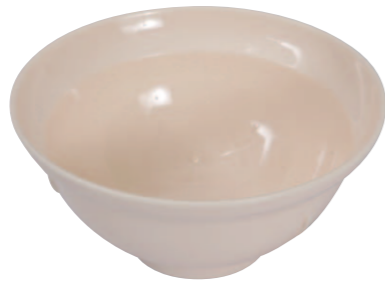
05 アイボリーどんぶり ●サイズ=150×70mm ●容量=600cc ●使用例=うどん・そば