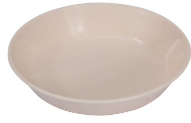
09 アイボリー深皿 ●サイズ=183×37mm ●使用例=カレー