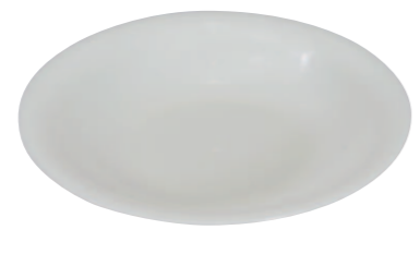
08 ホワイト中皿 ●サイズ=190×18mm ●使用例=焼きそば・焼まんじゅう