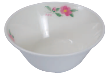
02 柄付きおわん小 ●サイズ=135×55mm ●容量=390cc ●使用例=かき氷・ところ天