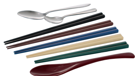
12 箸・スプーン ●箸サイズ=180mm~215mm ●カレースプーン=195mm(赤)※ =180mm(ステンレス) ●デザートスプーン=130mm(ステンレス)