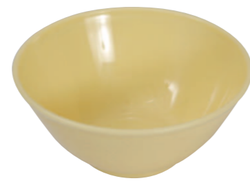
06 黄色どんぶり大※ ●サイズ=160×70mm ●容量=700cc ●使用例=うどん・そば