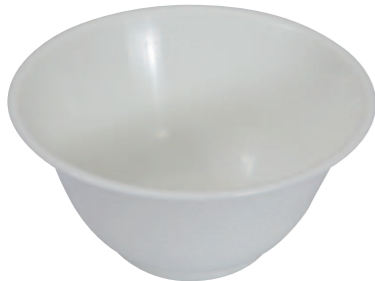
04 ホワイトどんぶり小 ●サイズ=145×70mm ●容量=540cc ●使用例=豚汁