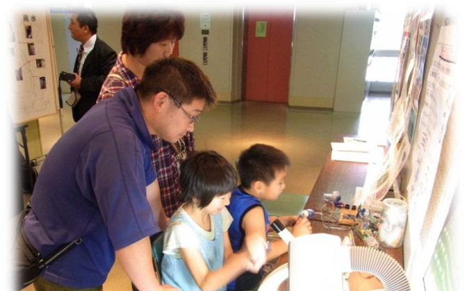
沼田環境フォーラムにて 手回し発電機を使って発電中の親子