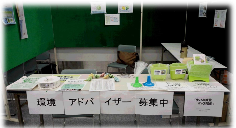
環境フェスティバル出店ブース

出展内容は、ごみ減量化に向けて、①台所の流し台で使う水切りグッズの紹介、②一般ごみに関するデータの展示、③古紙回収時に古紙を束ねる紙ひもの説明、配付などを行いました。また、新規環境アドバイザーの募集活動を合わせて行いました。