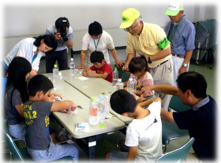
身近な水環境の調査