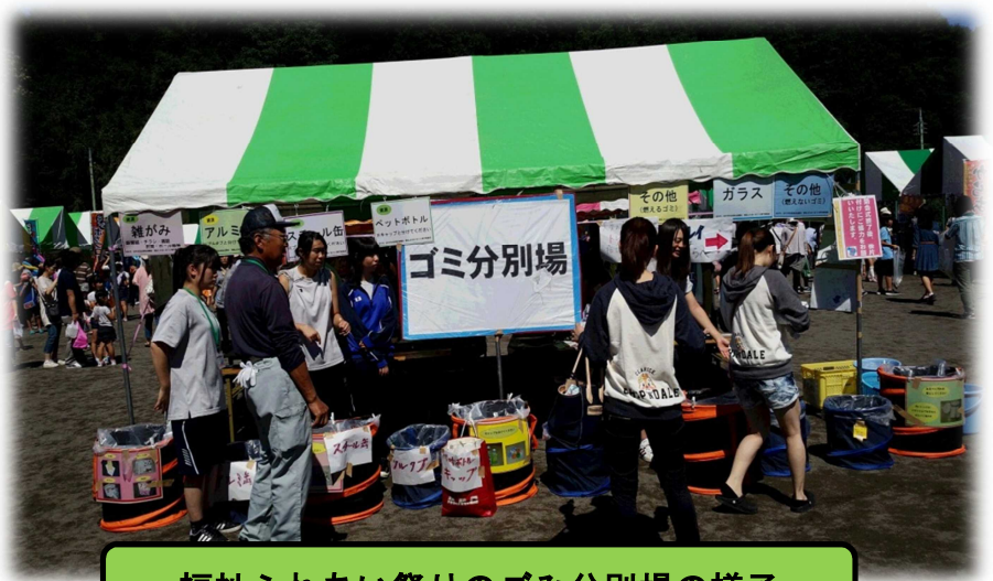
福祉ふれあいまつりのごみ分別場の様子