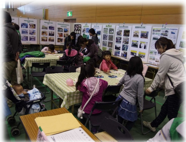
（毎年好評のお絵かきマイバック作り）

11月15日に恒例の太田市産業環境フェスティバル・消費生活展が開催され約100の団体が出展し約1万2千人が来場しました。