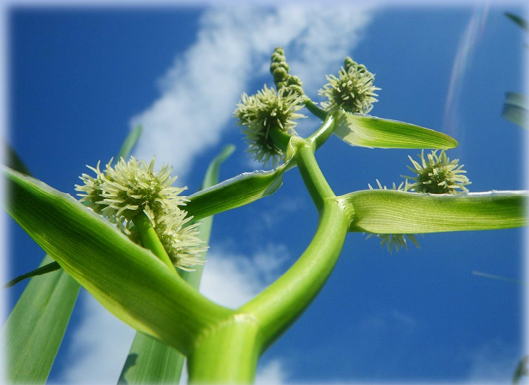
群馬県絶滅危惧Ⅱ類「ミクリ」

たとえ良く行くフィールドであっても、今の自分に見えているのは、まだまだ片一方の半面のみ。しかし、外部の人が光を当ててくれることで、今まで見えていなかった新たな半面がペラリと一瞬で現れる。ミクリは、こんな未来の現れ方もあるのだ！と実感させてくれた思い出の植物です。