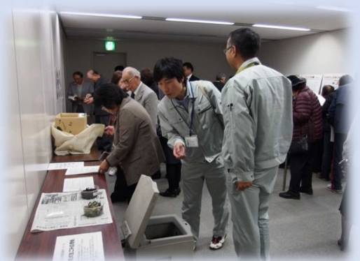
展示コーナーの様子