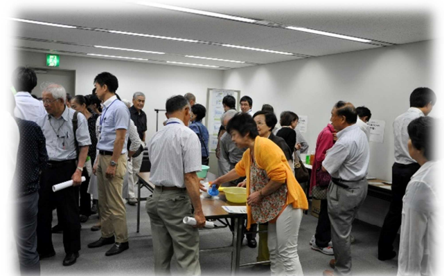
エコグッズ等の展示コーナーには大勢の方が訪れ、出展者と活発な意見交換、情報交換