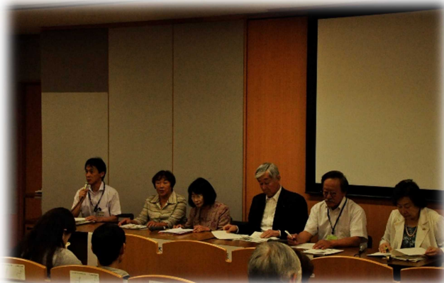
「第二部事例紹介&パネルディスカッション」のパネリストの皆さん