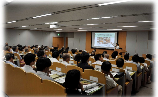
熱心に聞き入る参加者の皆さん